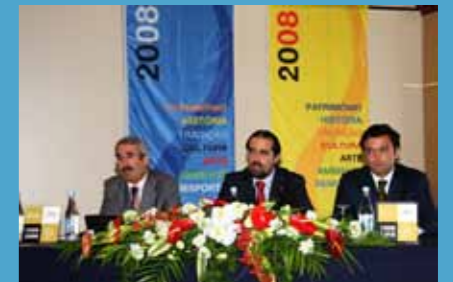
VI European Congress of Places with Marina/Yachting Harbor. Opening/Abertura